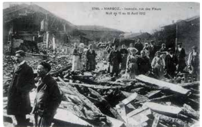
Photo ci-dessous de l'incendie du 16 avril 1912.

Désormais, seul le socle imposant du monument est toujours visible devant la mairie, le buste en bronze ayant été réquisitionné en 1941 et fondu au profit de l'occupant allemand.